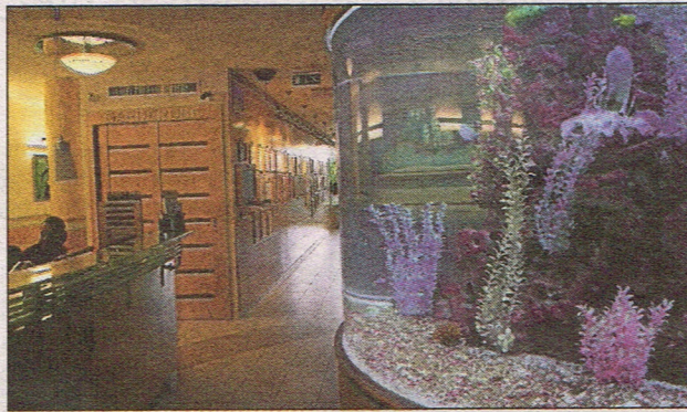
Hammasklinikan valtava akvaario rauhoittaa ja vie ajatukset pois poran hurinasta.